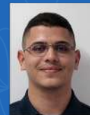
Igor Jose Adilson Eletromédicos | 25