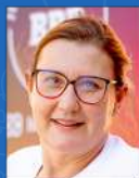
Rita Alves Descartáveis | 15