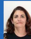
Viviane Antoniassi Endovascular | 14