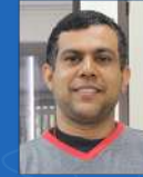
Wellington Alves Mecânica | 31