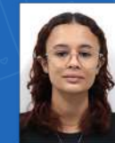
Suelen de Andrade Descartáveis | 07