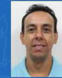
Mario Francisco Logística | 15