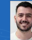
Wellington Domingues Lab. de Microbiologia | 31