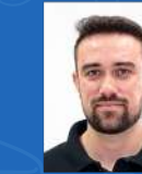
Fernando Istartari Supply Chain | 17