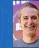
Denilson Parra Logística | 19