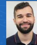
Leonardo Facina Qualidade | 07