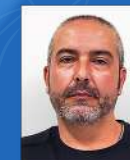
Danilo Ferraz Logística | 01