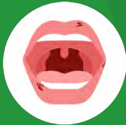
Feridas na boca que não cicatrizam