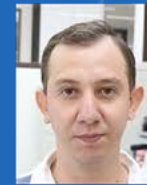
Rafael Vieira Descartáveis | 05