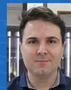
Vitor Sandoli Comercial | 15