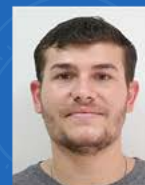
Fernando Andrade Mecânica | 15