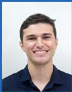
Giovanni Bazan Descartáveis | 02