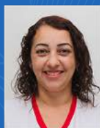
Ivanete Rossi Endovascular | 30