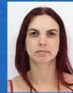
Kassia Folla Endovascular | 11