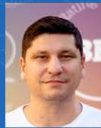
Andre Pronti Descartáveis | 03