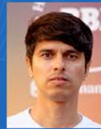
Erik Furtado Endovascular | 09