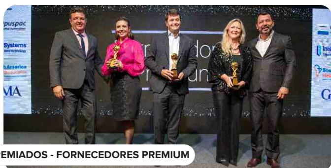
PREMIADOS - FORNECEDORES PREMIUM

Você faz parte disso. Agradecemos sua dedicação e comprometimento!