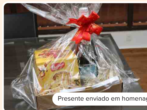
Presente enviado em homenagem

Sua colaboração para a cidade, para o mundo e para a vida das pessoas é mais uma comprovação desse propósito tão importante que vivemos até hoje na Braile Biomédica, de cuidar das pessoas dando acesso a produtos de qualidade e colaborando com a troca de conhecimento entre os profissionais.