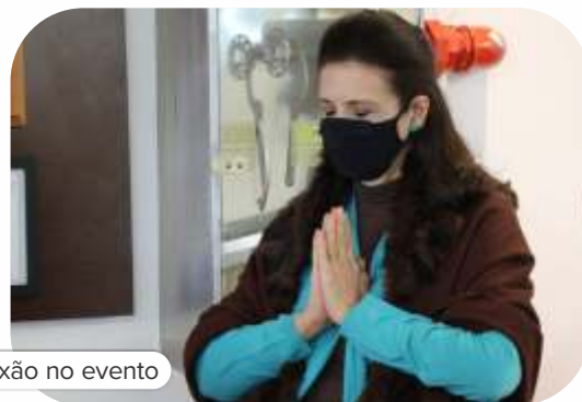
Durante reflexão no evento