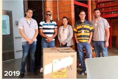
Campanhas de Agasalho