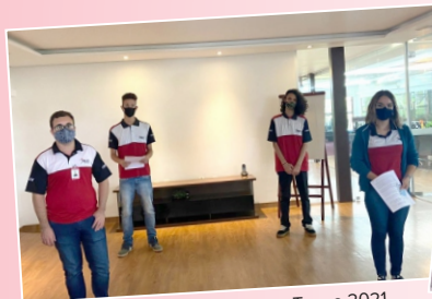
Jovens - Turma 2021

Além dos projetos que geram oportunidades de emprego e desenvolvimento para jovens, como o Força Jovem e o Programa de Estágio, conheça algumas campanhas e eventos solidários em que a Braile e nossos colaboradores sempre se engajam.