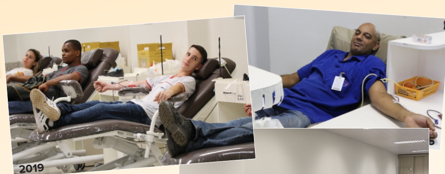
Campanha de doação de sangue