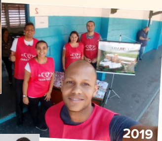
Caravana da Cidadania