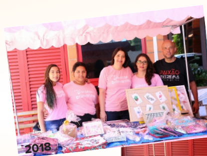
Apoio ao Projeto Garotas Brilhantes