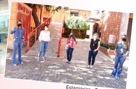
Estagiárias - Turma 2021