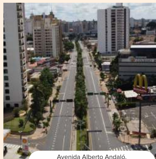
Avenida Alberto Andaló.

Contamos sempre com a responsabilidade de todos para colaborar com as ações de enfrentamento do novo coronavírus, evitando principalmente a circulação desnecessária.