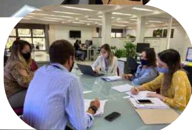
Durante auditoria nos setores