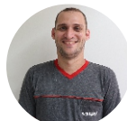
Renato da Silva Logística - 11