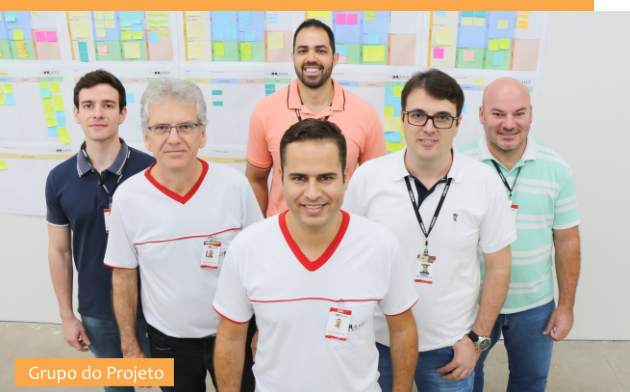
Grupo do Projeto