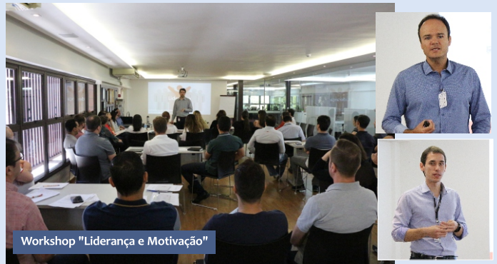
Workshop "Liderança e Motivação"

A Braile Biomédica acredita que uma boa gestão, aliada à constante atualização da equipe, capacita e desenvolve as habilidades dos colaboradores e traz muitos benefícios para a empresa, já que interfere diretamente nos resultados. Frequentemente são realizados treinamentos com convidados renomados em diversos assuntos, com a finalidade de capacitar, comunicar de forma eficaz e alinhar todos com a estratégia da empresa.