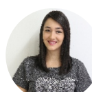
Caroline Bianchini Comunicação - 16