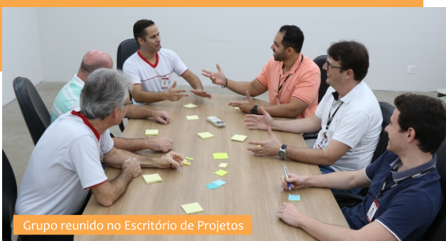
Grupo reunido no Escritório de Projetos