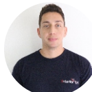
Hudson da Rocha Logística - 03