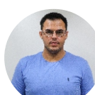
Lenardo Biesso Usinagem - 26