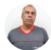
Ivo Junior Usinagem - 07