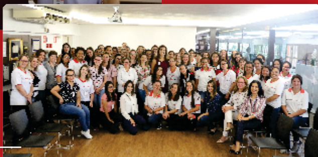
Após a palestra, todas as mulheres com a palestrante