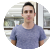
Tharcis de Souza Usinagem - 06