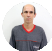
Célio Oller Usinagem - 28