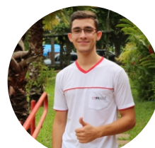
Iago Silva Descartáveis - 20