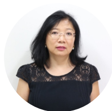
Midori Okubo Programação Visual - 01