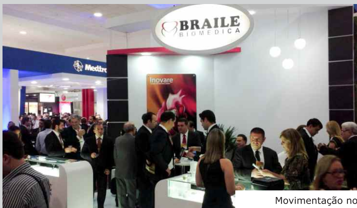
Movimentação no estande da Braile