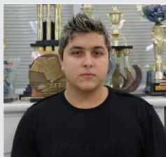
Bruno Scalon Descartáveis - 16