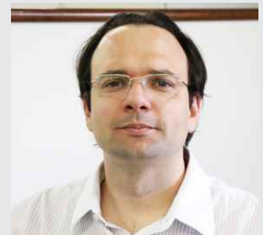
Guilherme Agreli Produtos - 05