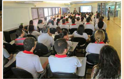
Colaboradores na palestra