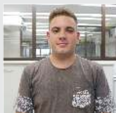
Wellington Lacerda Serviços Gerais - 04