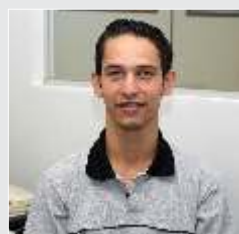
Tiago Abreu Usinagem - 09