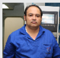
Wanderlei Junior Usinagem - 17