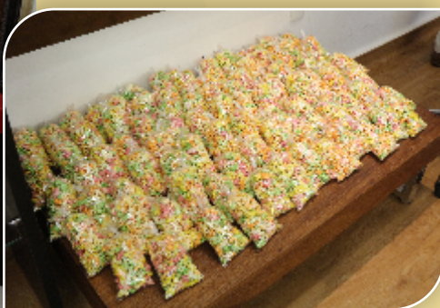
Lembrancinhas entregues para as crianças

A Braile Biomédica agradece a todos pela presença!