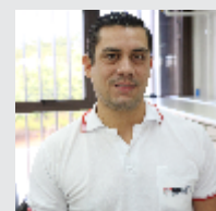
Eder Bonafe Endovascular - 21