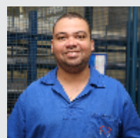
Fabio Rosa Usinagem - 19