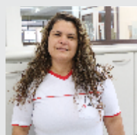
Vanderlea Oliveira Descartáveis - 25