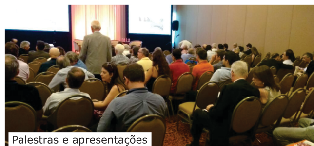
Palestras e apresentações