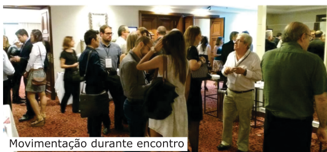
Movimentação durante encontro