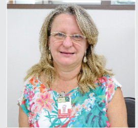
Maria da Penha Industrial - 04

As causas das doenças cardiovasculares são diversas, mas podem estar relacionadas com o seu estilo de vida e a sua alimentação. Mude seus hábitos, pratique uma vida mais saudável.