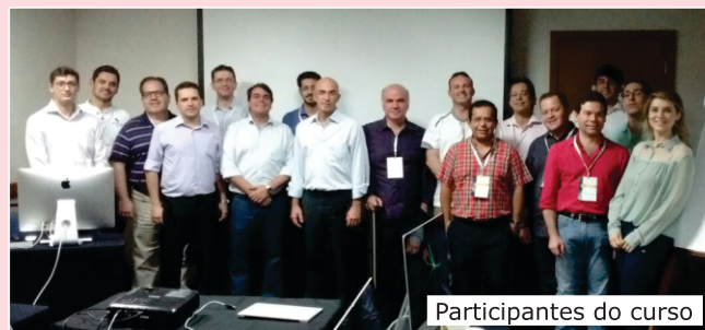
Participantes do curso