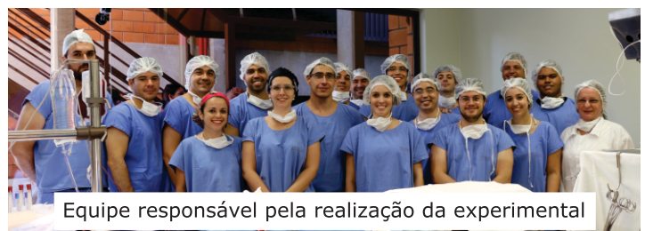
Equipe responsável pela realização da experimental