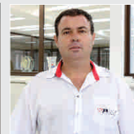
Mario Ribeiro Logística - 09