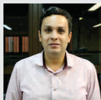
Lino de Oliveira Engenharia e processos-16