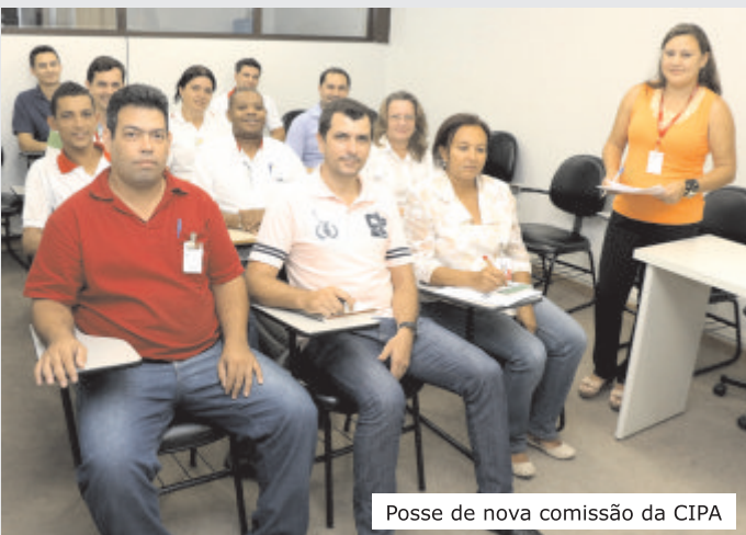
Posse de nova comissão da CIPA

A votação para a escolha dos membros da CIPA-Gestão 2014 foi realizada em novembro de 2013.