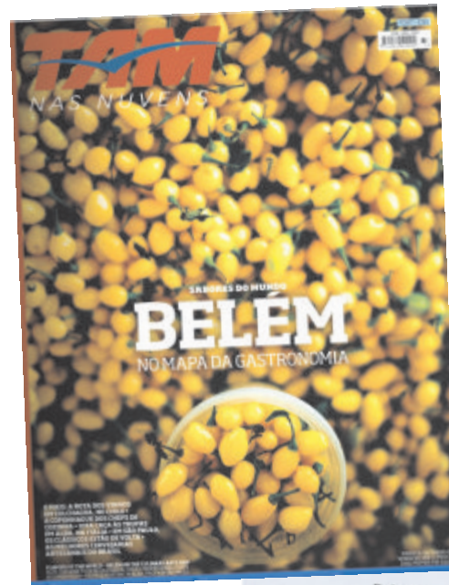
Imagem da capa da Revista "TAM nas Nuvens"

Orgulho para nós, orgulho para Rio Preto e todo o Brasil!