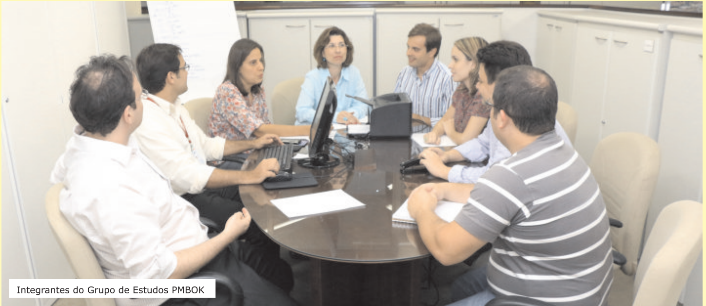
Integrantes do Grupo de Estudos PMBOK

Braile cria grupo para implementação de metodologia de gestão de projetos