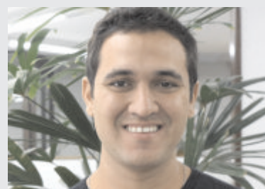
Ricardo Siqueira Logística - 20