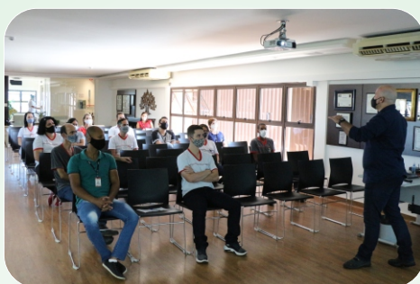
Cipeiros em treinamento