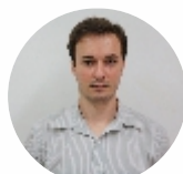
Anderson Fuzaro Qualidade - 23