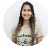
Bruna Almeida Contabilidade - 12