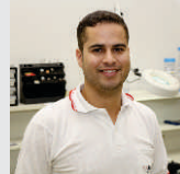
Paulo Corrêa Endovascular - 11