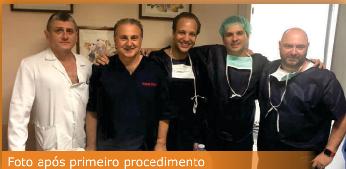
Foto após primeiro procedimento