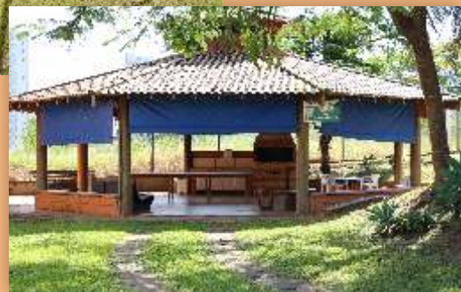
Quiosque, localizado no bloco H