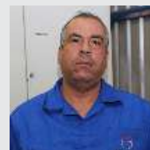
Ivo Cardoso Usinagem - 07