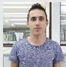
Tharcis de Souza Descartáveis - 06