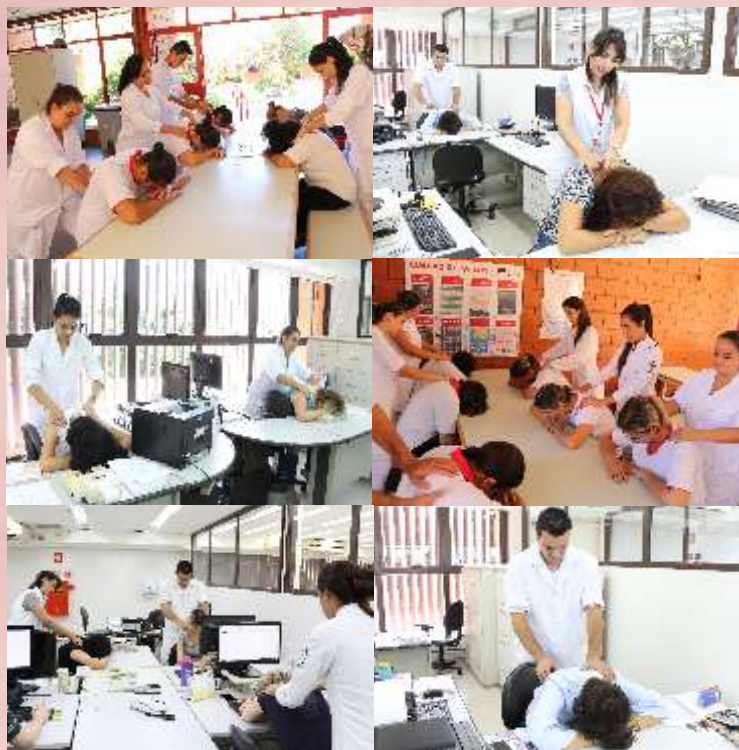
Alunos de fisioterapia da UNIP