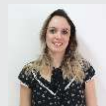
Glaucia Basso Pesquisa - 08