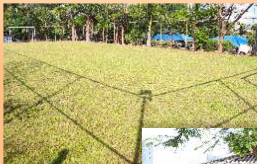
Campo, localizado acima do quiosque (bloco H)