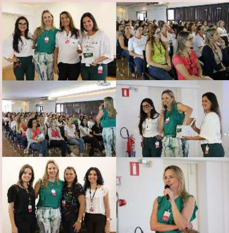
Foto ao final do evento