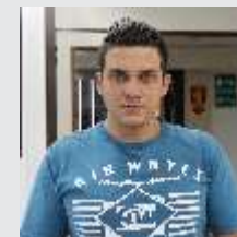
Lucas Rodrigues Endovascular - 12