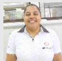
Valdirene Neris Serviços Gerais - 29