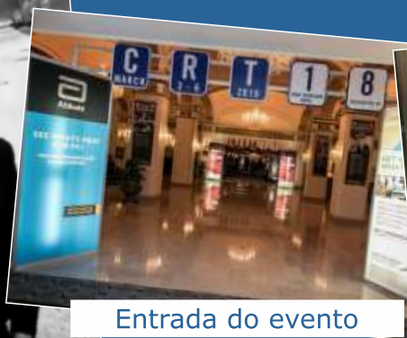
Entrada do evento