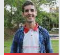
Eberton Silva Descartáveis - 14