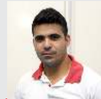
Ricardo Bento Descartáveis - 16