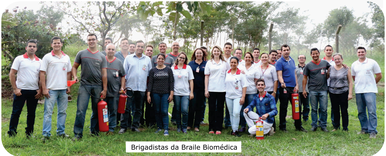
Brigadistas da Braille Biomédica