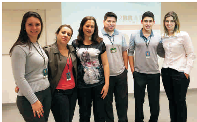
Hospital da Unimed