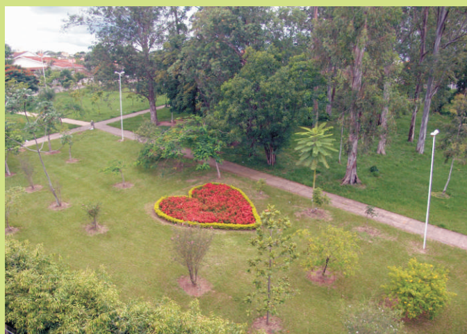
Praça Salua Haddad Homsí