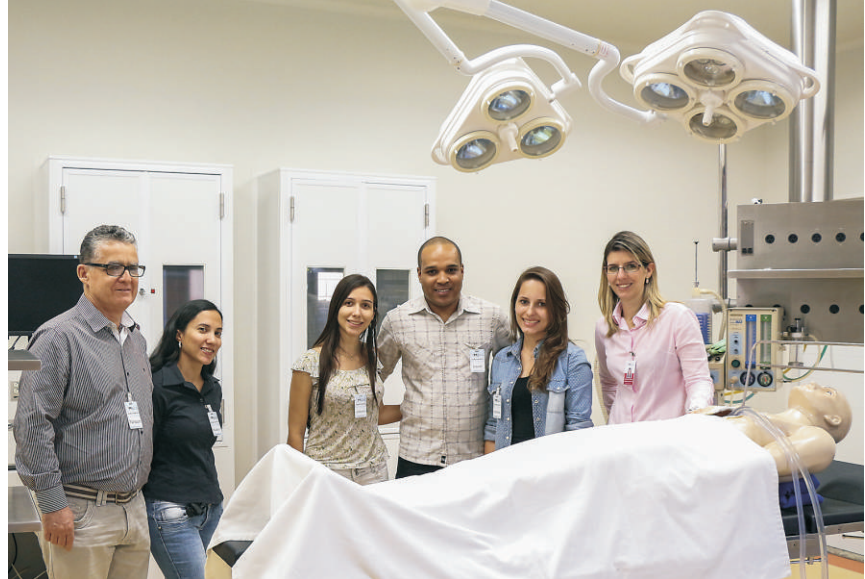
Alunos de perfusão conhecem o centro experimental da Braile Biomédica