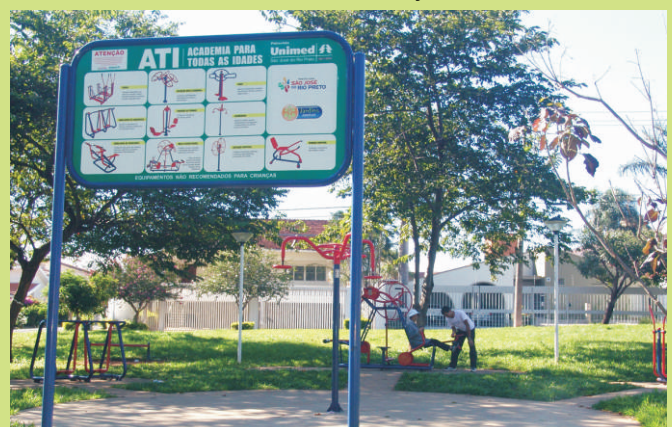
Academia/ Área de convivência na praça