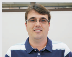
Cleber Rosa Endovascular - 17