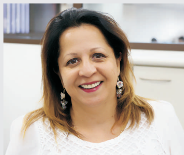
Darcilei Montalvão Serviços Gerais - 15