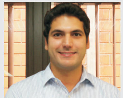
Lineu Andrade Exportação - 21