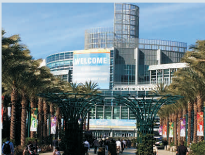
Anaheim Convention Center