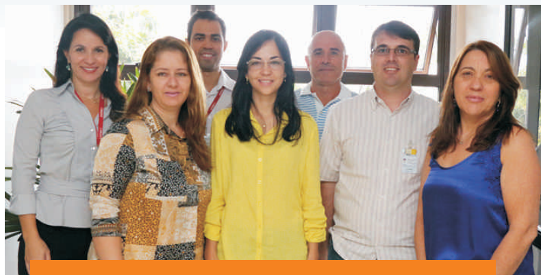
Integrantes do primeiro grupo que irá apresentar o seminário "Administração Estratégica"

O primeiro seminário será sobre "Adminis-