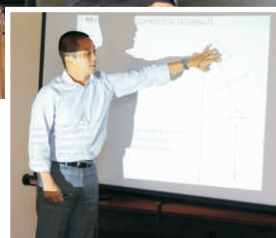
Thiers ministra treinamento técnico sobre os produtos da Braile