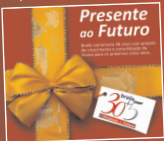
Selo do Projeto 30 +5

Braile 30+5: Presente ao Futuro. Projeto de crescimento e consolidação da marca para os próximos cinco anos.