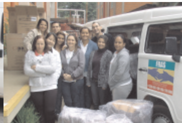
Prova Eskenta - Agasalhos