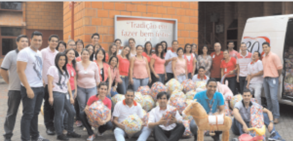
Prova Fazendo Arte - Brinquedos

Foi realizada, durante o ano, a "Gincana Solidária".