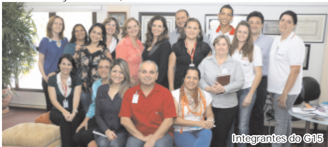
Integrantes do G15

Foram criados os Comitês Internos de Comunicação: G6, G15 e G30.