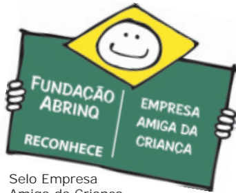
Selo Empresa Amiga da Criança

Jovens em Ação: nova turma participa do Projeto Força Jovem da Braille Biomédica.