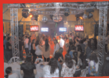
Festa #TamoJunto comemora os 30 anos da Braile Biomédica