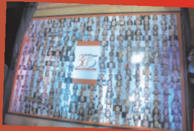
Mural com fotos dos colaboradores vira símbolo do projeto