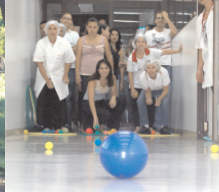
Gincana 30 anos

Foi realizada, durante o ano, a "Gincana Solidária".