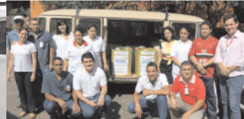
Prova Caldeirão - Alimentos

Braile 30+5: Presente ao Futuro. Projeto de crescimento e consolidação da marca para os próximos cinco anos.