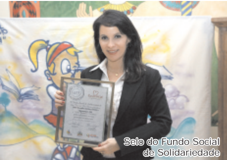
Selo do Fundo Social de Solidariedade

Braille recebe selo de Empresa Solidária e renova parceria com Abrinq - Empresa Amiga da Criança.