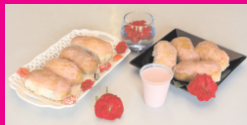
Café da Manhã especial servido aos colaboradores

A popularidade do Outubro Rosa alcançou o mundo de forma bonita, elegante e feminina, motivando e unindo diversos povos em torno de tão nobre causa. Isso faz que a iluminação em rosa assuma importante papel, pois tornou-se uma leitura visual, compreendida em qualquer lugar no mundo. (Fonte: Kathlen Amado / Blog da Saúde)