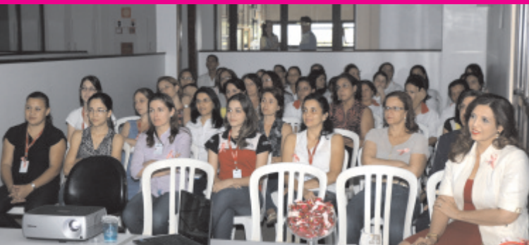
Colaboradoras da Braille participam da palestra de prevenção do Câncer de Mama