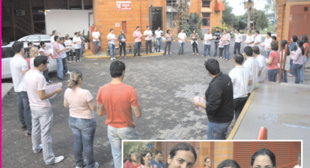
Colaboradores participam de dinâmica

"Foi um grande prazer participar da campanha. Confesso que enquanto preparava as dinâmicas aprendi bastante. A informação e conhecimento estimulam a prática das ações preventivas. Vamos nos cuidar", relatou Viviane.