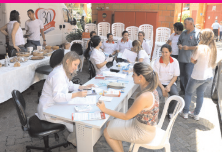
Profissionais do Instituto Domingo Braille faz atendimento nos colaboradores da Braille

No dia 25, uma equipe de profissionais do Instituto Domingo Braille promoveu o evento "Cuidados e Dicas para a Saúde" para os colaboradores da Braille Biomédica, realizando medição de pressão, glicemia e índice de massa corpórea (IMC), com orientações, exposição e degustação de produtos alimentícios indicados para diabéticos e para quem procura uma alimentação mais saudável.