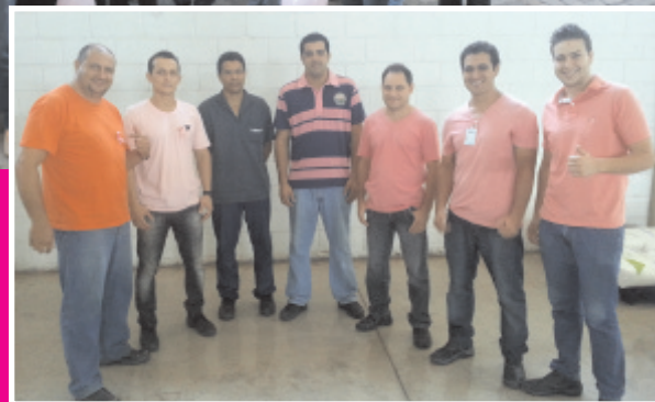
Colaboradores da Unidade 2 também participaram da campanha