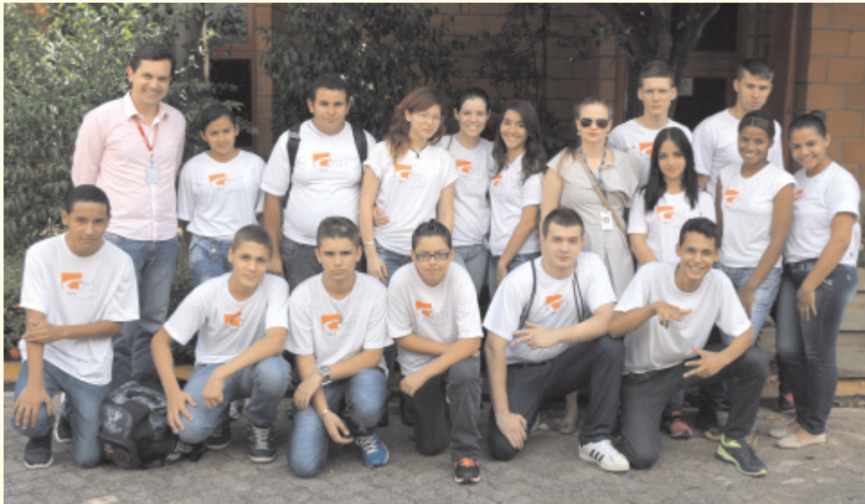
Alunos do curso de Auxiliar de Escritório do SENAC