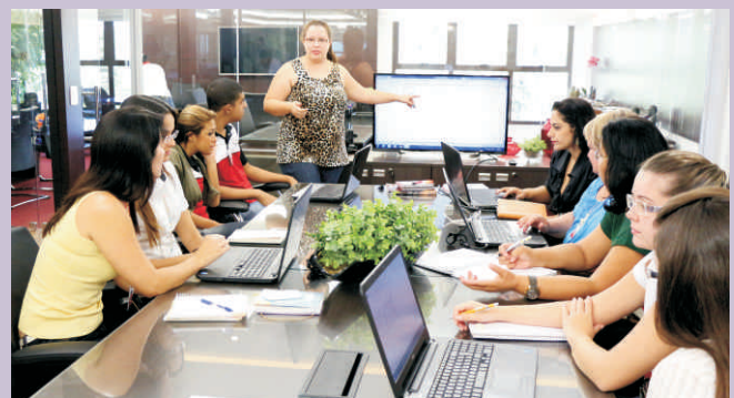
Colaboradores participam de treinamento sobre EXCEL

No mês de maio nova turma receberá o treinamento.