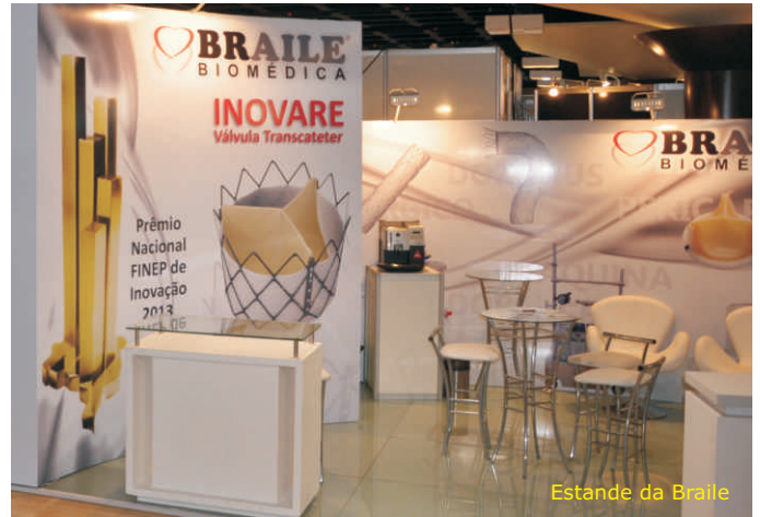
Estande da Braile

Na semana passada, 3 a 5 de abril, a Braile Biomédica participou do 41º Congresso Brasileiro de Cirurgia Cardiovascular, em Porto de Galinhas-PE. Uma grande oportunidade de estarmos juntos a um público seletivo e direcionado, apresentando nossos produtos e serviços. Como sempre, nosso estande recebeu muitas visitas durante os três dias de evento. O Congresso foi um sucesso, e agora já começam os preparativos para o CICE 2014 (Congresso Internacional de Cirurgia Endovascular) que será realizado de 23 a 26 de abril, na capital paulista.