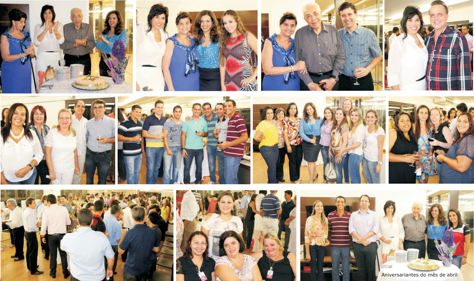
Aniversariantes do mês de abril