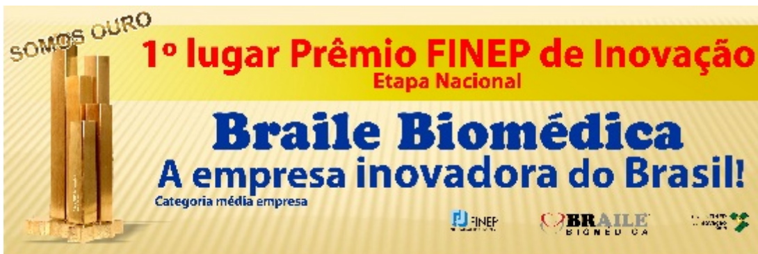
Arte do outdoor

Eles estão localizados: Avenida Juscelino K. de Oliveira (próximo ao Rancho do Cupim), Avenida Francisco Chagas (avenida Shopping) com Rua Raul Silva, Avenida Juscelino K. de Oliveira com Francisco Chagas (lado direito sentido Recanto Real).