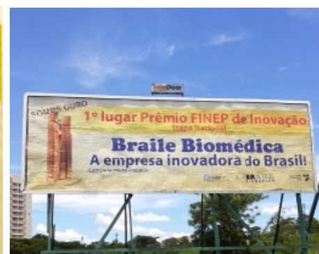
Outdoor localizado próximo ao Rancho do Cupim