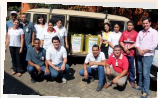
Colaboradores fazem entrega para instituição de caridade