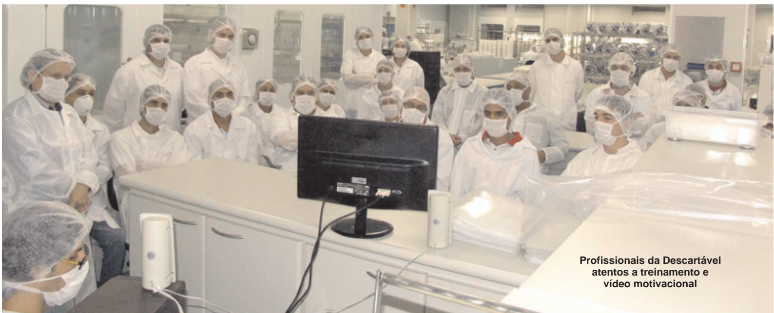
Profissionais da Descartável atentos a treinamento e vídeo motivacional

A supervisora apresenta também vídeos de motivação no trabalho para os colaboradores. “Hoje é possível conseguir melhores resultados na busca de um ambiente adequado para o desenvolvimento das atividades profissionais”, diz Penha.