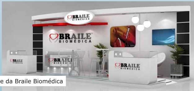
Estande da Braile Biomédica

Este congresso é o único na América Latina dedicado exclusivamente à Terapia Endovascular.