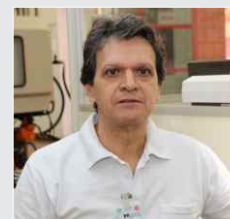
Célio Ferraz Injeção - 03