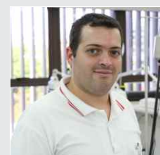
Bruno Ribeiro Endovascular - 30