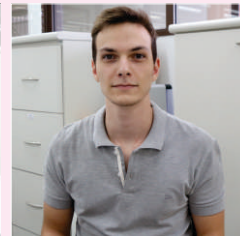
Leonardo Veroneze Exportação - 07