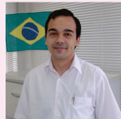
Marcos Vinicius Eletromédicos - 02