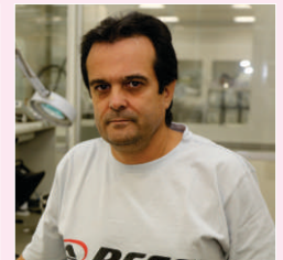
Edson Gonçalves Eletromédicos - 05