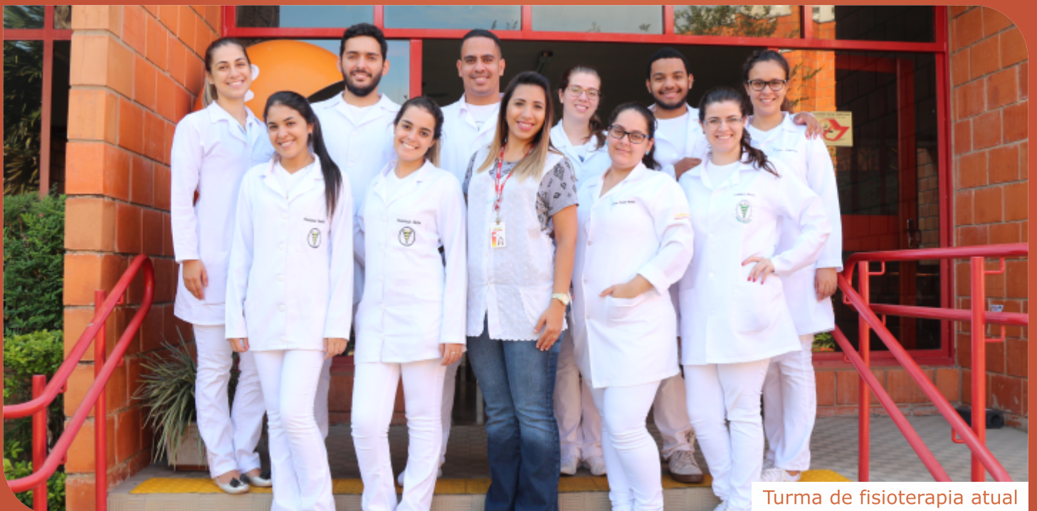
Turma de fisioterapia atual