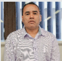
Gelson Martins Eletromédicos - 17