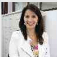
Carline Miglioli RH / Comunicação - 24