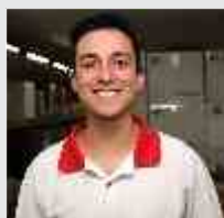
Rafael Panhozzi Logística - 28