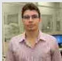
Ricardo Araujo Eletromédicos - 01