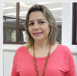
Maria Betania Comercial - 20