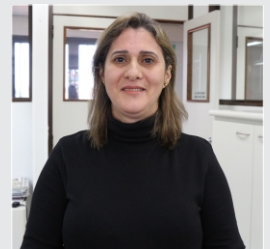
Soelena Xavier Biológica - 19