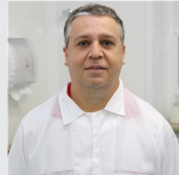
Antônio Pavezzi Descartáveis - 19