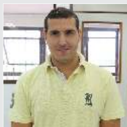
Fagner Ferreira Logística - 28