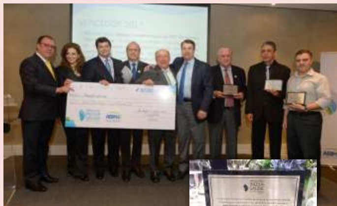
Finalistas do Prêmio

A empresa participou com o Sistema para Perfusão Intraperitoneal, solução que contribui para a melhora da qualidade e a expectativa de vida de pacientes com doença restrita ao peritônio.