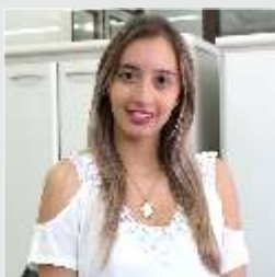
Milena Fachini Exportação - 20