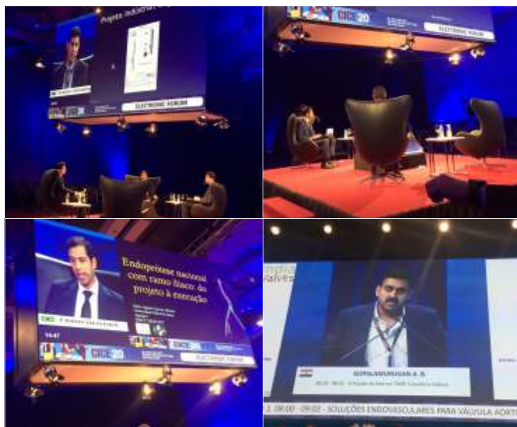
Fotos da Mesa Redonda Eletrônica e convidado especial

A Braille Biomédica agradece a participação, presença e doação pessoal de todos para o sucesso do evento!