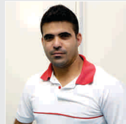
Ricardo Bento Descartáveis - 16