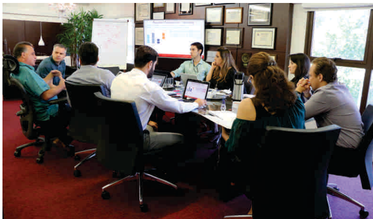
Segundo sessão com os profissionais, na Braile Biomédica