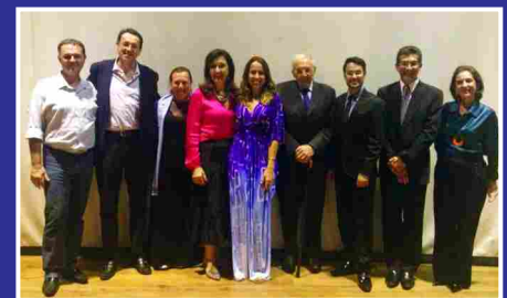
Participantes do Talk Show

"Foi um momento muito importante receber ilustres profissionais, pessoas maravilhosas, reunidas num mesmo local, conversando com responsabilidade e competência sobre um assunto tão delicado e sério como o câncer, e, principalmente tratando com delicadeza e sensibilidade esse tema. Foi realmente um evento que marcou", concluiu a psicóloga.