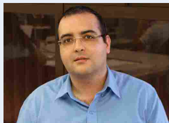
Fabricio Ventura Logística - 03