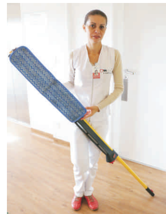
Refis de microfibra: removem até 95% dos micro-organismos