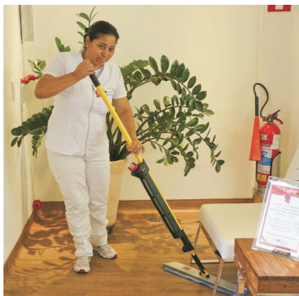
Mop Plus: cabo ergonômico evita lesões por esforço repetitivo