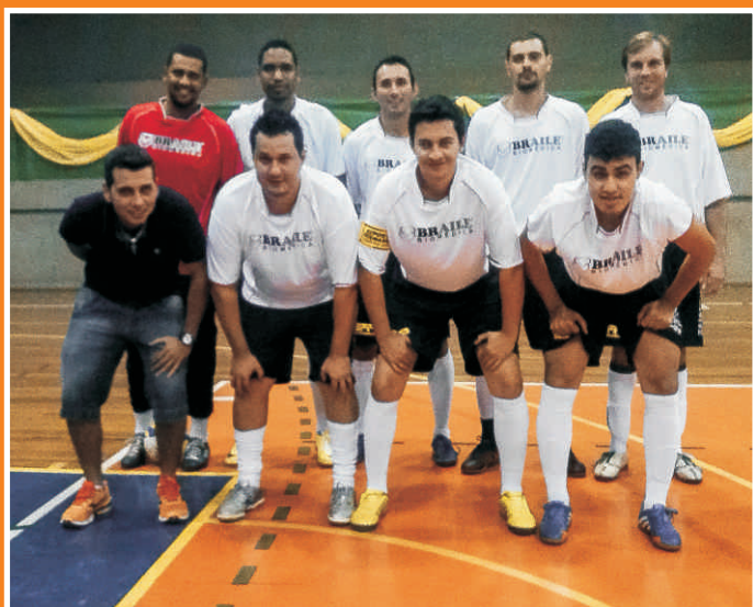
Braile-B estreia com vitória nos Jogos do SESI