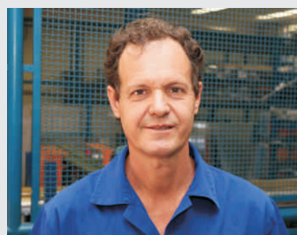
Laerte de Bianchi Usinagem - 18