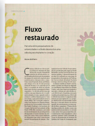
Página da matéria