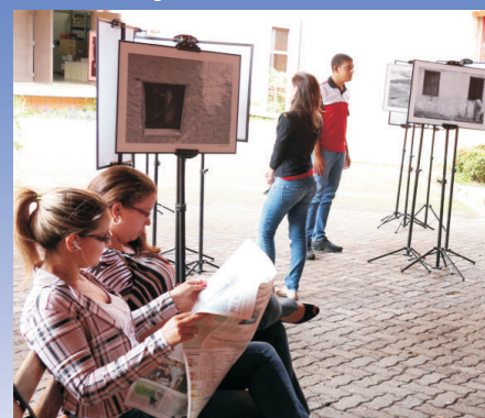
Exposição, livros, jornais, revistas, tudo à disposição dos colaboradores. Confira na pág. 7