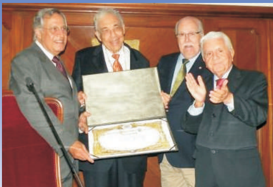
Dr. Braille é empossado Membro Honorário, na Academia Nacional de Medicina.