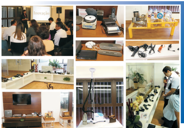
exposição mostra a inovação de vários tipos de produtos