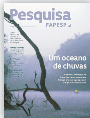
Capa da Revista

http://issuu.com/pesquisafapesp/docs/pesquisafapesp_217?e=4497040%2F7035885#search