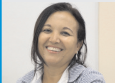
Solange Dourado Projetos - 19