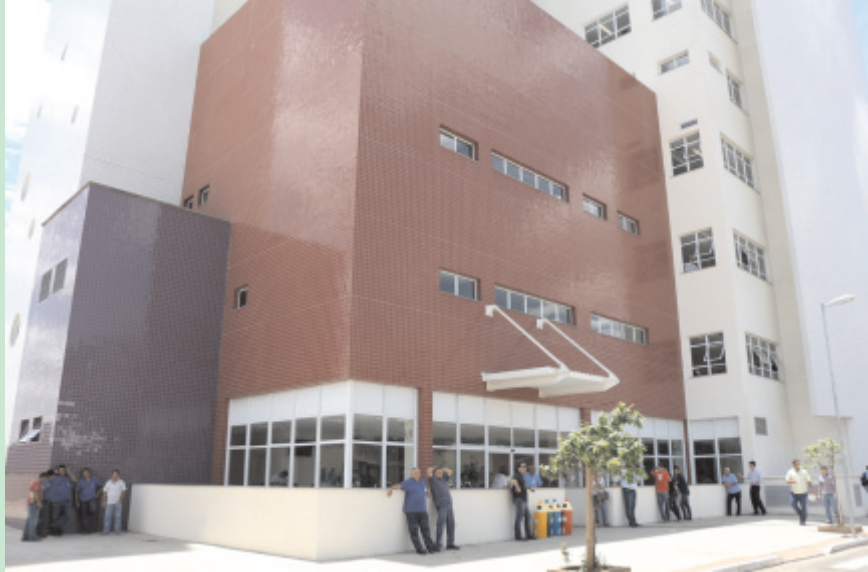
Vista frontal do Hospital da Criança durante inauguração