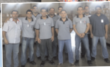
Equipe vencedora "SOS com Amor" e representantes das demais equipes