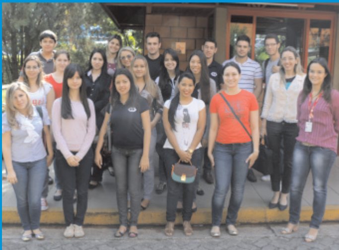
Alunos do curso de Administração da Unip