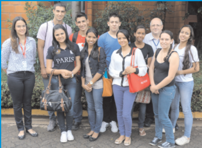
Alunos da turma 37 do Senac