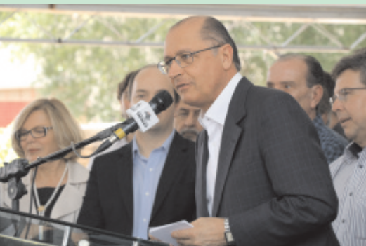
Governador Geraldo Alckmim faz pronunciamento durante inauguração