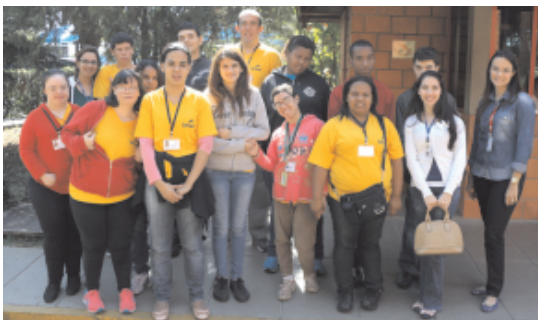
Alunos do Projeto Pet Trampolim