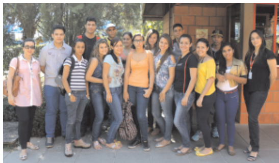
Alunos do curso de Aprendizagem - turma 42