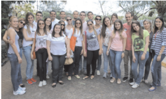
As duas turmas do curso de Medicina da Unilago