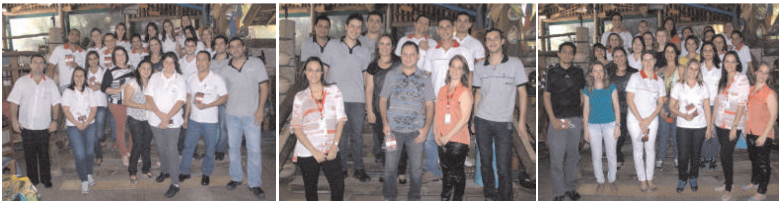
Colaboradores da Biológica, Almoxarifado, Unidade II, Microbiologia e Cardioplegia (que compõem a equipe "SOS com Amor") no almoço de comemoração no Rancho do Cupim

Queremos, mais uma vez, agradecer a equipe vencedora e todas as que participaram desta etapa da Gincana.