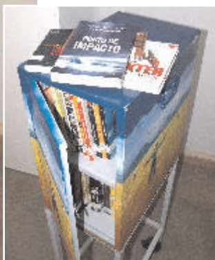
Caixa-Estante Braille - Unidade I