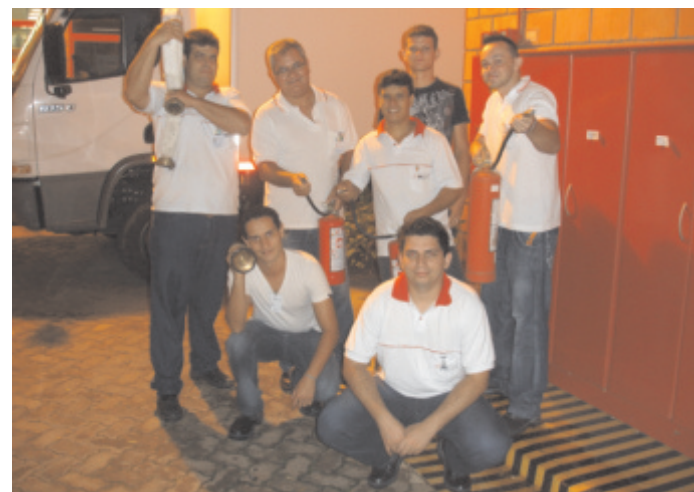
Integrantes da Equipe de Combate