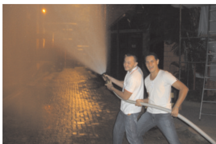
Integrantes da Brigada realizam o treinamento prático