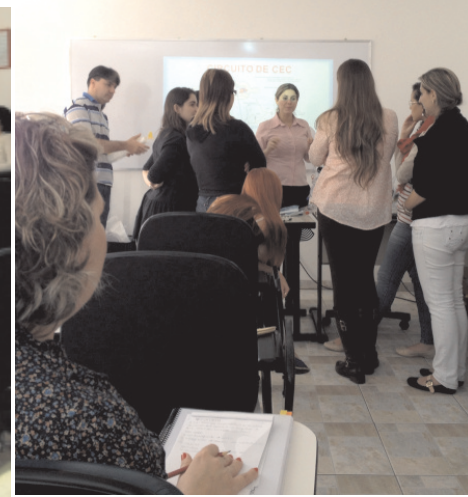
Robersi ministra aula de Circulação Extracorpórea (CEC) em Porto Alegre