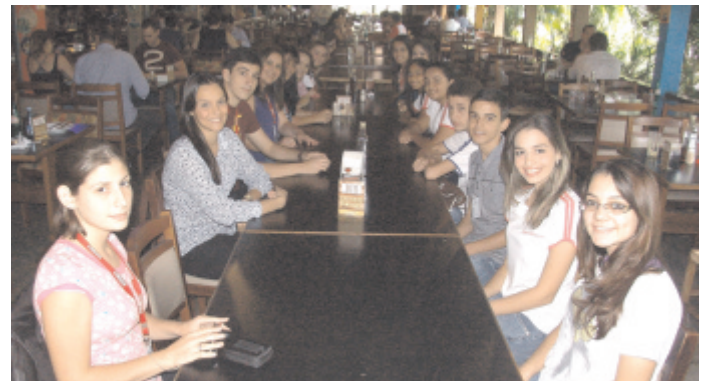
Almoço de confraternização

Os jovens aprendizes da Braille pertencem à Arprom e Fulbeas.