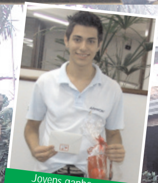
Jovens ganharam kit e cartão