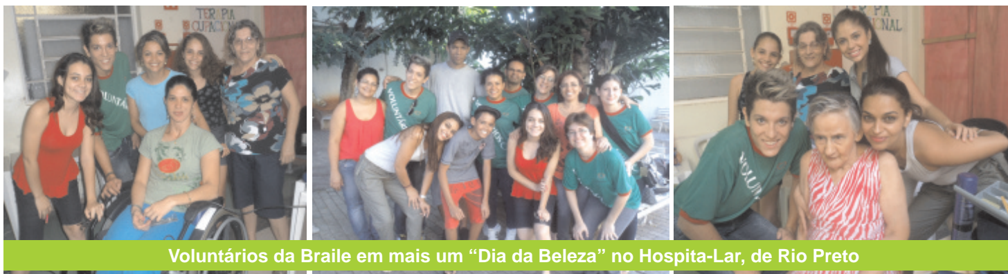
Voluntários da Braile em mais um "Dia da Beleza" no Hospita-Lar, de Rio Preto

Mais uma ação voluntária foi realizada pelos companheiros da Braile no dia 20 de abril, no Hospita-Lar Nossa Senhora das Graças, de Rio Preto. O grupo de voluntários se dedicou mais uma vez aos pacientes do Hospita-Lar, realizando o "Dia da Beleza", alegrando o dia