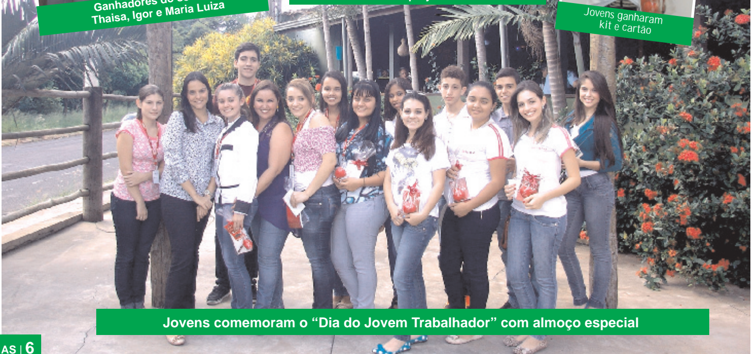
Jovens comemoram o "Dia do Jovem Trabalhador" com almoço especial