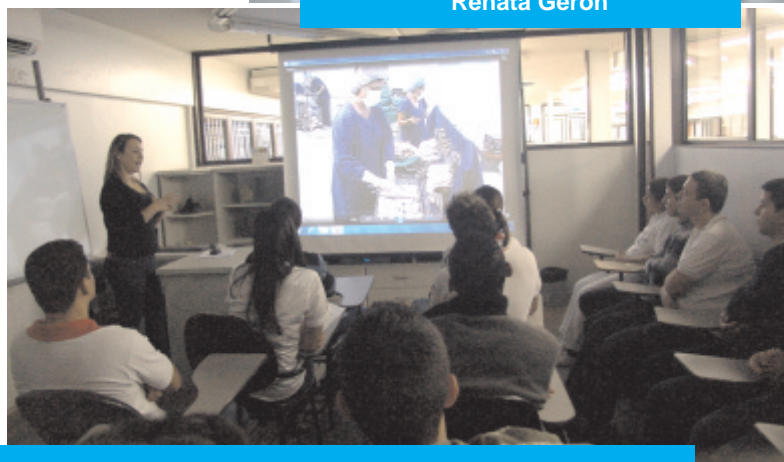
Colaboradores participam do “Treinamento Básico Braile Biomédica”